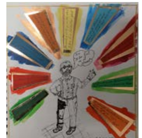
Deze kunstwerken werden gemaakt door deelnemers van Het kunstige dagboek. Daar mag iedereen helemaal zichzelf zijn.